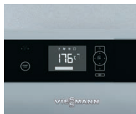
Régulation Ecotronic 100 à écran lumineux pour une commande simple et intuitive

La Vitoligno 150-S est une chaudière compacte à gazéification pour bûches de bois, d'un prix particulièrement attrayant, adaptable à un fonctionnement monovalent ou à un fonctionnement bivalent (complément à une installation de chauffage au fioul ou au gaz).